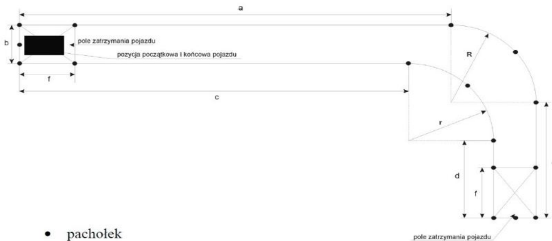
Rysunek nr 1.

W przypadku kategorii B+E, C1+E, C+E, D1+E, D+E, T dopuszcza się trzykrotne opuszczenie miejsca kierowcy i pojazdu w czasie wykonywania zadania.